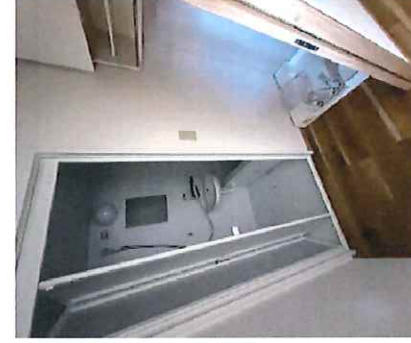
【リノベーション工事後※204号】