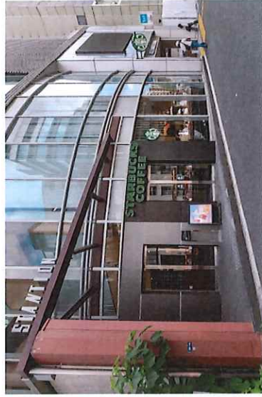
1階店舗・エントランス