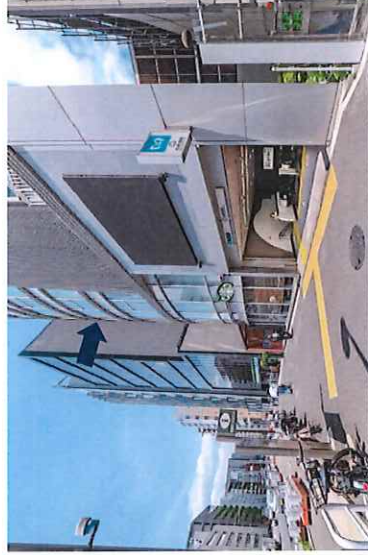
物件前歩道・北参道駅出口