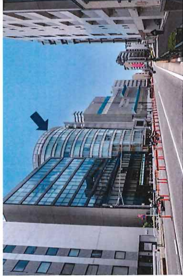
南西側接道（明菜通の）