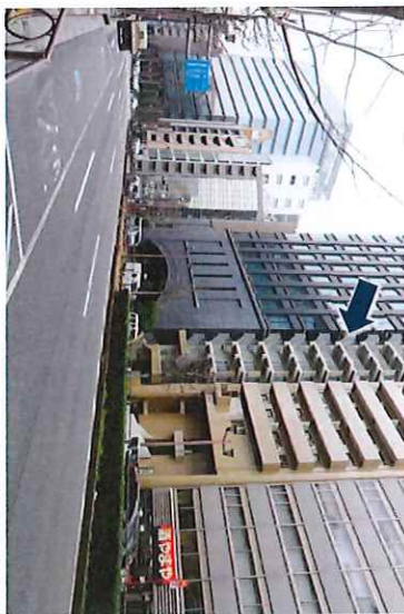
南側接道(新橋通り)②